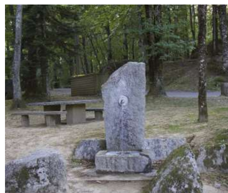
Mise en place et branchement de la fontaine sur l'aire de Beyriès.

Location d'une nacelle spéciale par une entreprise locale pour intervenir sur la toiture et les chenaux de l'église, et remédier ainsi aux fuites récurrentes.