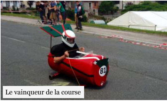
Le vainqueur de la course

Même si, étonnamment... monsieur Orage s'est invité cette année et a quelque peu perturbé la soirée de samedi, la fête a une fois de plus été un franc succès, et a permis à chacun de se retrouver pour des moments de rigolade et de détente.