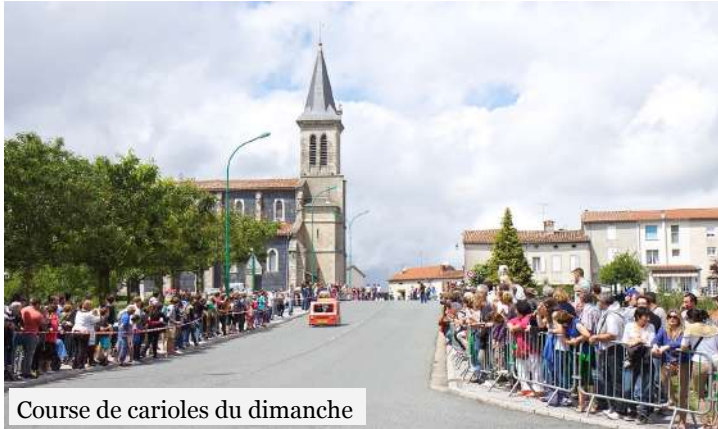
Course de carioles du dimanche

Une équipe du Comité des Fêtes, aidée de la Pena et de la Bodéga du théron, toujours très active et volontaire que nous souhaitons remercier pour son implication dans la vie du village.