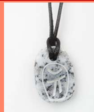
Pendentif en granit

Si vous avez un cadeau original à faire, ou tout simplement envie de vous faire plaisir, allez donc les découvrir à l'Office du Tourisme du Sidobre à Vialavert, le meilleur accueil vous sera réservé.