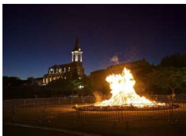
Au feu les pompiers...