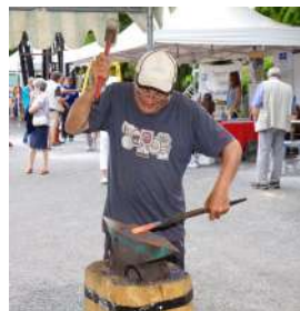
Affûtage à l'ancienne