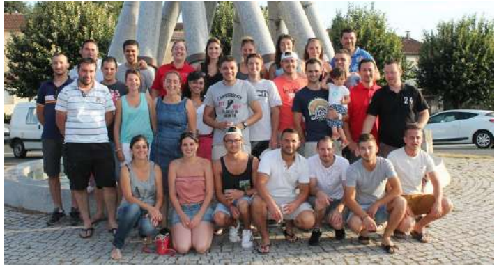
L'équipe du Comité des fêtes au grand complet...

Le 20 juin se déroulait sur la place du Théron une manifestation à l'occasion de la journée nationale des sapeurs pompiers . Un nombre important de personnel a participé à cette cérémonie, ainsi que de nombreuses autorités.