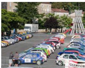
Le rallye du Sidobre