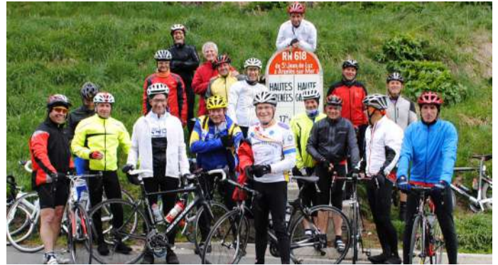
Sortie 2015 au Col de Peyresourde dans les Pyrénées

86 voitures au départ... 66 à l'arrivée pour la 12ème édition du Rallye du Sidobre . Belle animation dans le village pour le plus grand plaisir des amateurs de belles cylindrées.