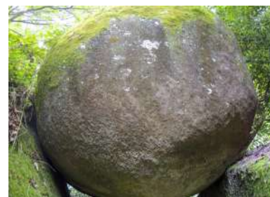
Qu'es aquò ?