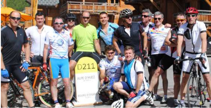
Sortie 2014 à l'Alpes d'Huez