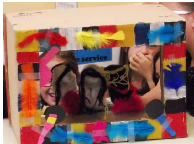
Théâtre de marionnettes réalisé durant les N.A.P.